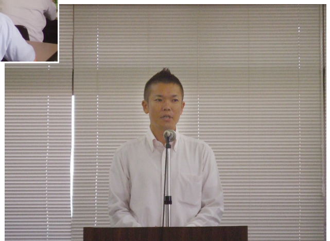
小西青年部会長あいさつ

これからの業界についての熱い話を聞きながら、青年部員全員親睦を深めることができました。