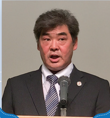
清水会長あいさつ