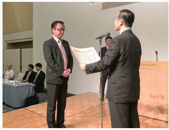
知事感謝状 實平高章氏