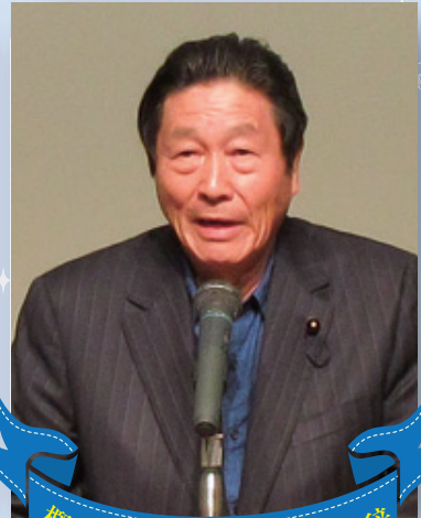
櫻本孝徳島県議会議員祝辞