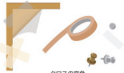
クロスの変色 (日照などの自然現象によるもの)、壁等の画紙、ピン等の穴