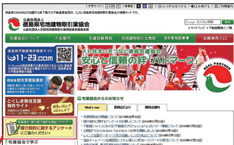
協会ホームページ